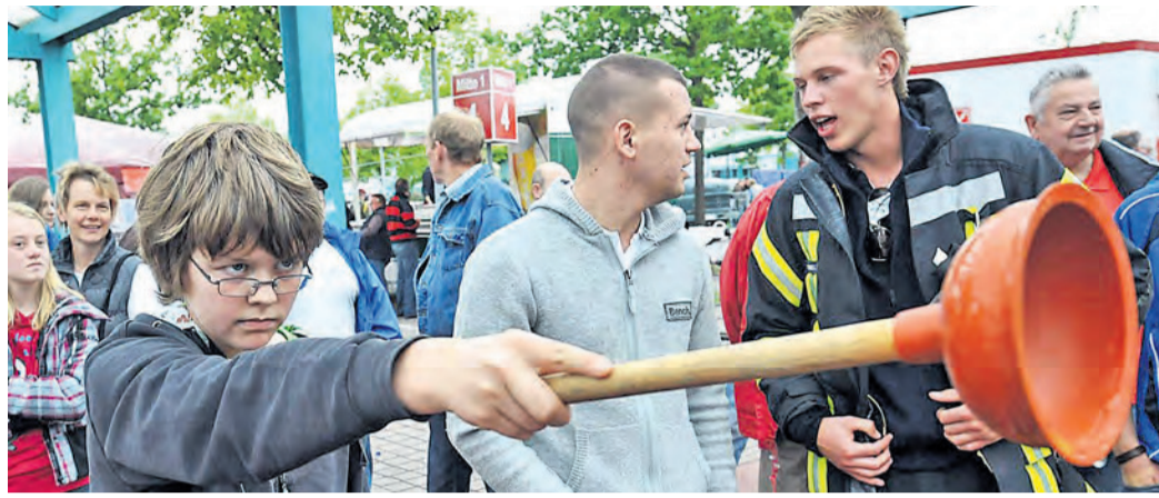
Die richtige Balance aus Kraft und Technik entscheiden beim Werfen des Pümpels.

Wer begeisterter Dartspieler ist, sich aber eine Reise in den Ally Pally (Mekka des Darts) nicht leisten kann, wen