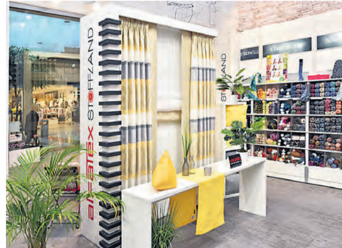
Im Alfatex Stoffland gibt es anlässlich des 50. Firmenjubiläums tolle Aktionen und attraktive Angebote.

„Wir lieben, was wir tun“ ist das Motto der Firma Alfatex. Seit fast 30 Jahren ist das Alfatex Stoffland im Weserpark eine Institution. Und da das Stammhaus in diesem Jahr 50 Jahre jung wird, feiern alle Filialen mit. Dabei gibt es bis zum 11. Mai super Angebote und Rabatte von bis zu 50 Prozent. Mode, Stil in Verbindung mit Nachhaltigkeit ist die Philosophie von Alfatex, die angebotenen Stoffe sind zum Teil Global Organic Textile Standard (GOTS) zertifiziert. Dies garantiert hohe ökologische als auch soziale Kriterien in der Produktion von Stoffen, Gardinen von der Fertigung bis zur Lieferkette.