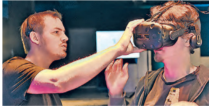
VR-Spaß für jede Generation und jeden Spielertyp.