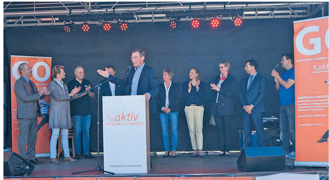
Hier geht die Post ab: auf der Aktionsbühne zwischen Weserpark und Möbelhaus Schulenburg gibt es Musik, Showacts und Sportvorführungen. Fotos: Archiv

„Marktplatz der Ideen“ ist das Motto - und der Weserpark die große Bühne, auf der sich nicht nur Aussteller aus den Bereichen Handel, Handwerk und Dienstleistung, große und kleine Unternehmen präsentieren, sondern auch zahlreiche Institutionen, Vereine und Verbände. Dazu gibt es natürlich auch noch ein bisschen Show, Stimmung und Unterhaltung, so dass die Besucher neben zahlreichen Infos auch viele Gewinnspiele geboten bekommen. Es ist eben dieser Mix, der die Faszination der Gewerbeschau ausmacht, die ein spannender und abwechslungsreicher Streifzug durch die Vielfalt des Stadtteils Bremen-Osterholz ist.